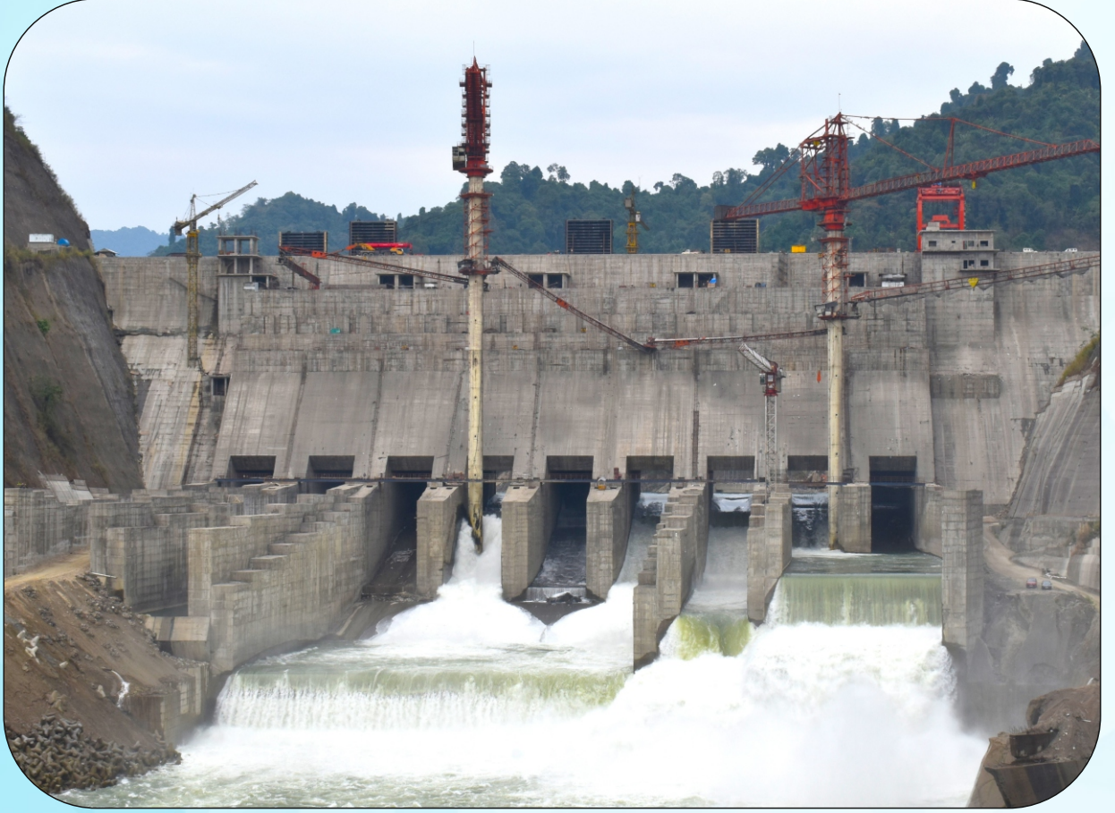
2000 MW Subansiri Lower HE Project, Assam / Arunachal Pradesh