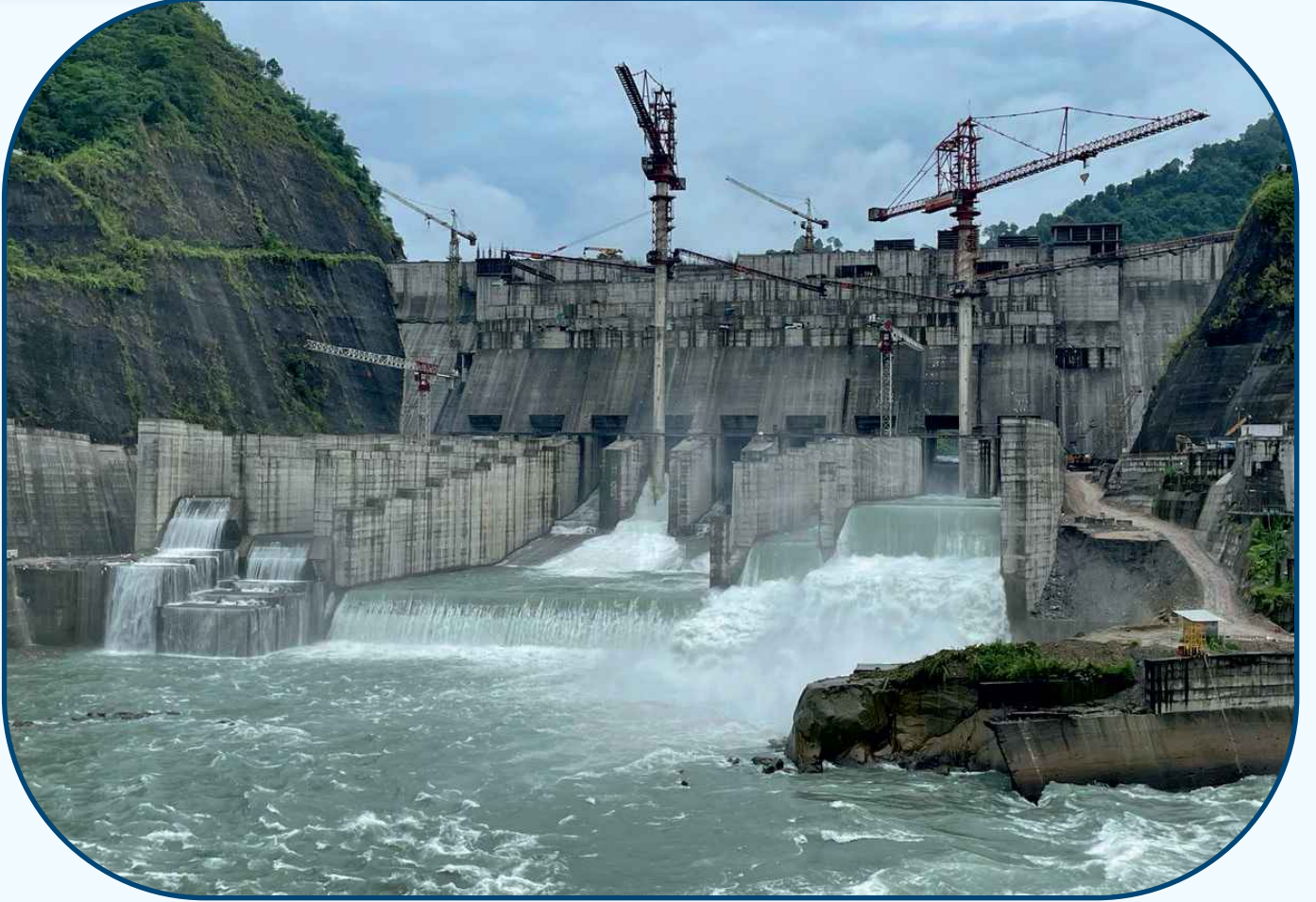
एनएचपीसी 2000 मेगावाट सुबनसिरी लोअर परियोजना, असम \ अरुणाचल प्रदेश