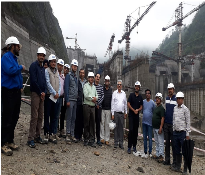
संयुक्त सचिव (हाइड्रो) महोदय व सीएमडी महोदय द्वारा परियोजना के मुख्य निर्माण क्षेत्रों का निरीक्षण

अध्यक्ष व प्रबंध निदेशक, एनएचपीसी और संयुक्त सचिव (हाइड्रो), विद्युत मंत्रालय, भारत सरकार द्वारा परियोजना दौरा