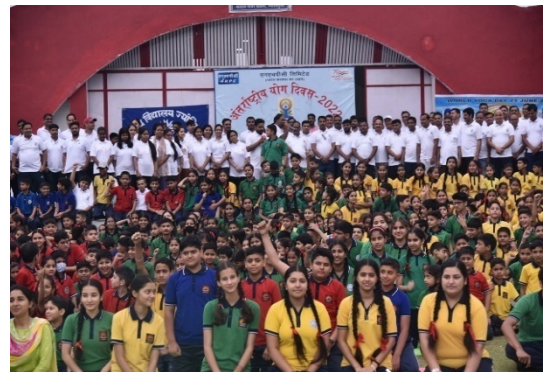
सलाल पावर स्टेशन