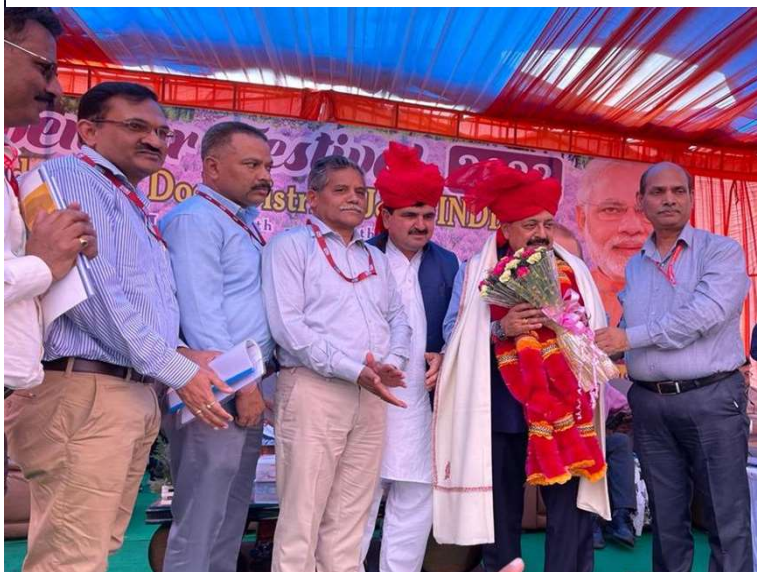
डा० जितेंद्र सिंह का अभिवादन करते हुए समूह महाप्रबन्धक महोदय