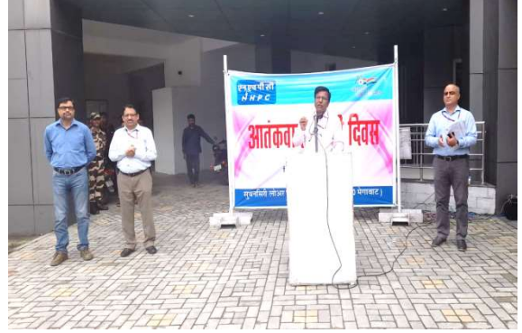
सुबनसिरी लोअर परियोजना