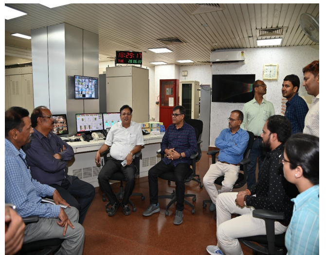
केंद्रीय जल इंजीनियरिंग सेवा के सदस्यों को पावर हाउस संचालन के विषय में बताते हुए पावर स्टेशनकर्मी

यह दौरा राष्ट्रीय जल अकादमी, पुणे द्वारा "इंजीनियरिंग भूविज्ञान-अवधारणाओं और इंजीनियरिंग परियोजनाओं के अभ्यास" पर अनुकूलित प्रशिक्षण कार्यक्रम के हिस्से के रूप में आयोजित की गई।