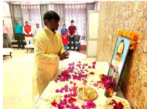
चमेरा -I पावर स्टेशन