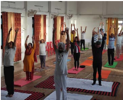
पार्वती - II परियोजना