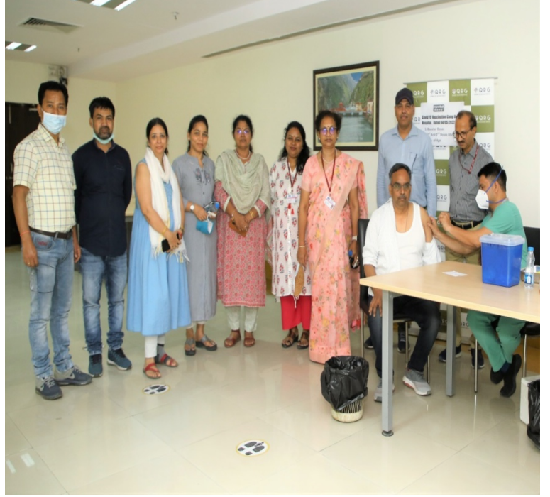
एनएचपीसी निगम मुख्यालय, फरीदाबाद में 4 कोविड-19 टीकाकरण शिविर का आयोजन

एनएचपीसी द्वारा 4 मई 2022 को एनएचपीसी निगम मुख्यालय, फरीदाबाद में 15 साल और उससे अधिक के लिए (पहली और दूसरी खुराक) और वयस्कों के लिए बूस्टर खुराक हेतु कोविड टीकाकरण शिविर (कोवैक्सिन और कोविशील्ड) का आयोजन किया गया। टीकाकरण शिविर के दौरान एनएचपीसी के कुल 160 कार्मिकों/पूर्व कार्मिकों और उनके परिवार के सदस्यों ने वैक्सीन की दूसरी खुराक/बूस्टर प्राप्त की जिसमें कोवैक्सिन के 20 और कोविशील्ड की 140 वैक्सीन शामिल थी। शिविर का आयोजन क्यूआरजी अस्पताल फरीदाबाद के सहयोग से किया गया।