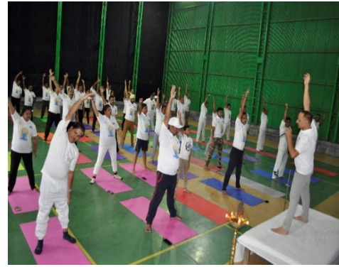
चमेरा- I पावर स्टेशन