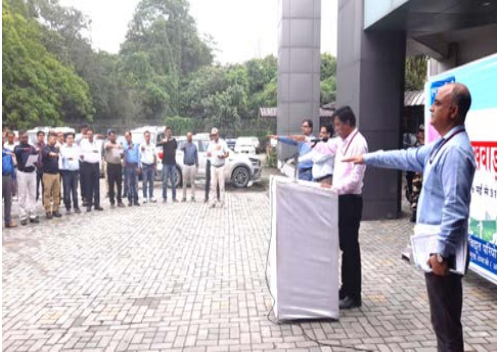
सुबनसिरी लोअर परियोजना