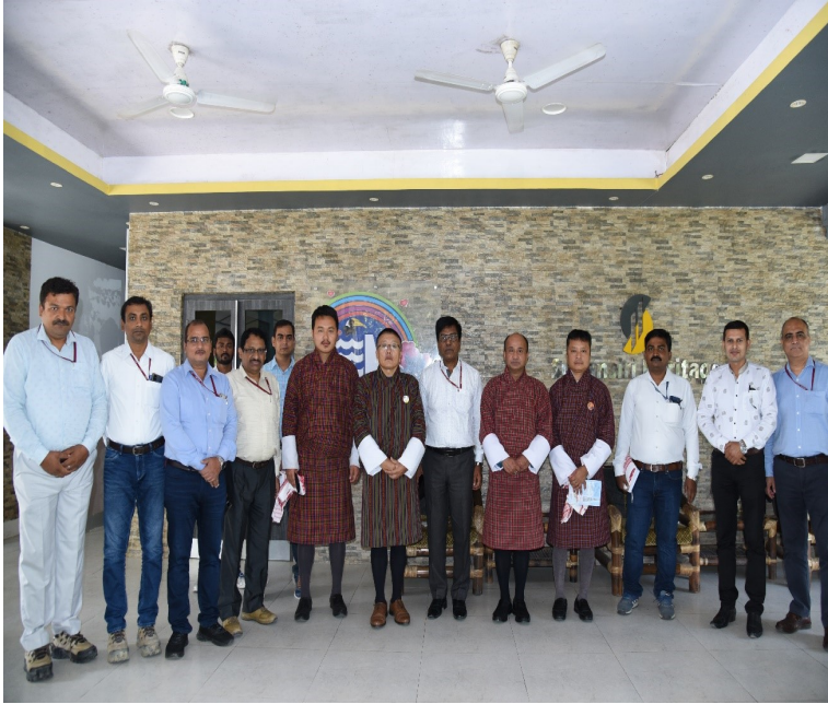
कार्यपालक निदेशक महोदय, माननीय मंत्री महोदय व अन्य सभी गणमान्य अतिथियों के साथ