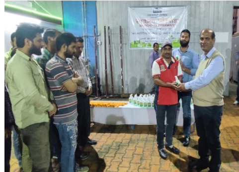
दुलहस्ती पावर स्टेशन