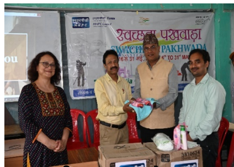
तीस्ता-V पावर स्टेशन