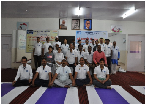
दुलहस्ती पावर स्टेशन