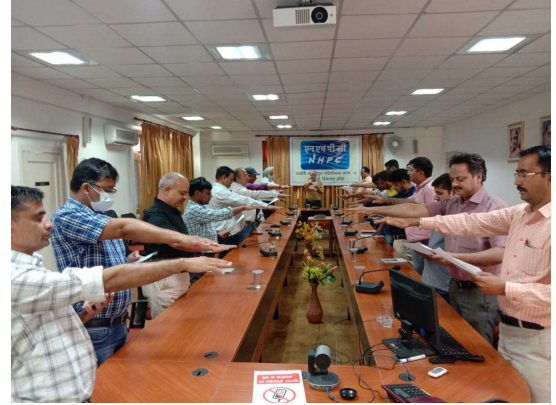
पार्वती- II परियोजना