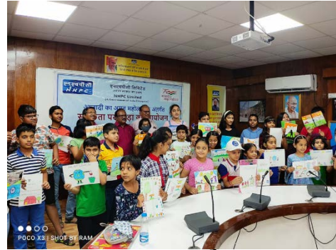
सलाल पावर स्टेशन