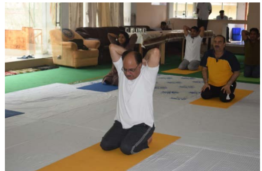
टीएलडी-III पावर स्टेशन