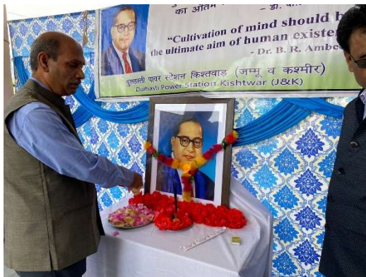
दुलहस्ती पावर स्टेशन