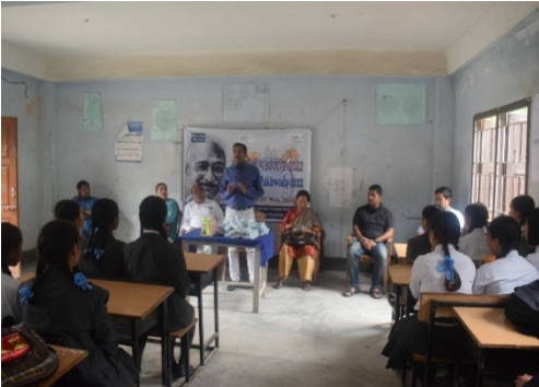
टीएलडी-III पावर स्टेशन