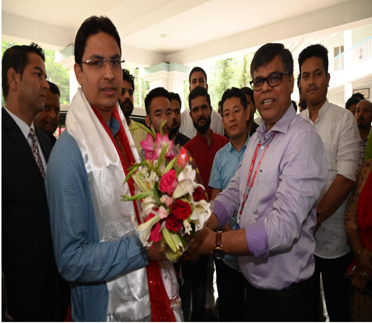
माननीय सांसद, दार्जिलिंग श्री राजू बिस्ता के आगमन पर परियोजना प्रमुख द्वारा स्वागत