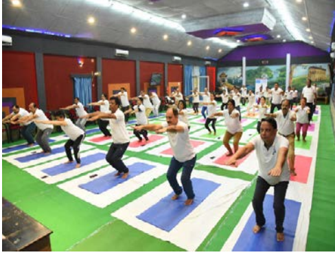
सुबनसिरी लोअर परियोजना