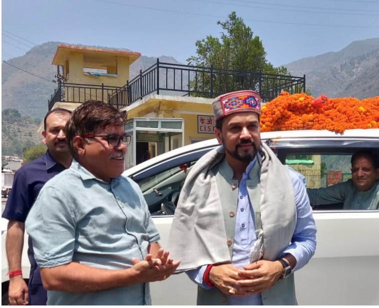
माननीय केन्द्रीय सूचना एवं प्रसारण व युवा कार्यक्रम और खेल मंत्री द्वारा बांध परिसर का निरीक्षण

दिनांक 14 मई 2022 को श्री अनुराग सिंह ठाकुर, माननीय केन्द्रीय सूचना एवं प्रसारण व युवा कार्यक्रम और खेल मंत्री, भारत सरकार ने चमेरा पावर स्टेशन-1 के बांध परिसर का संक्षिप्त दौरा किया।