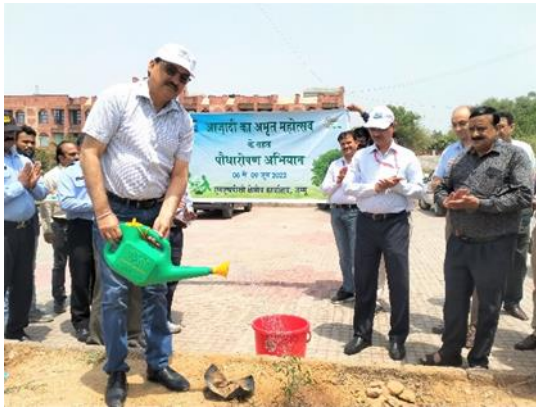
क्षेत्रीय कार्यालय जम्मू