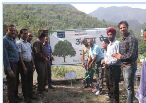
सेवा- II पावर स्टेशन