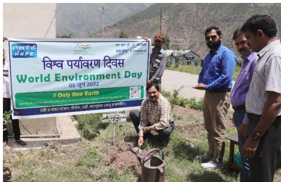
उड़ी- II पावर स्टेशन