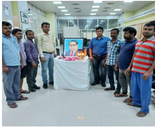
टीएलडी-III पावर स्टेशन