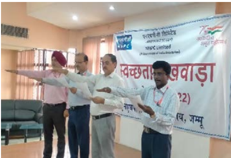
क्षेत्रीय कार्यालय जम्मू