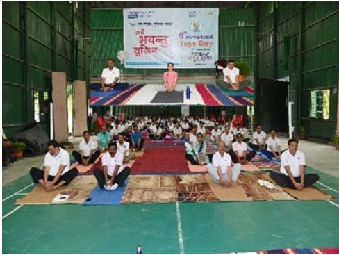
तीस्ता-V पावर स्टेशन