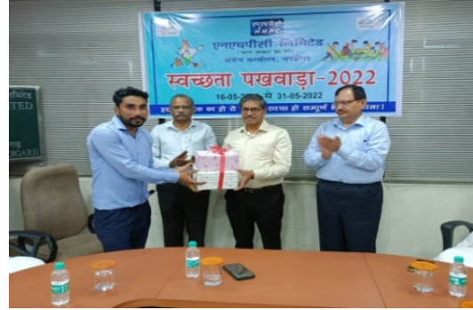
क्षेत्रीय कार्यालय चंडीगढ़