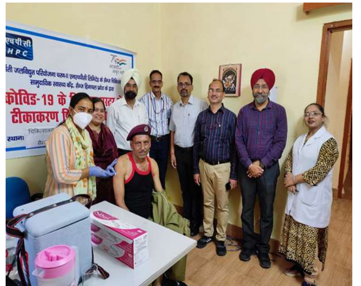
सामुदायिक स्वास्थ्य केंद्र सैंज में बूस्टर डोज़ कैंप का आयोजन

द्वारा लगभग 160 पंजीकृत की गई। इस आयोजन के लिए परियोजना चिकित्सा टीम ने सामुदायिक स्वास्थ्य केंद्र सैंज की टीम का आभार व्यक्त किया।