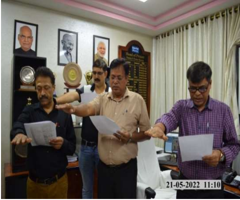
तीस्ता-V पावर स्टेशन