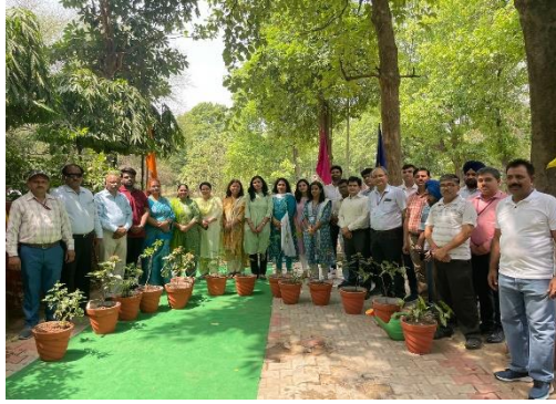
क्षेत्रीय कार्यालय चंडीगढ़