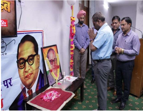
सेवा- II पावर स्टेशन