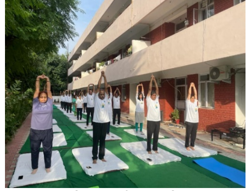
क्षेत्रीय कार्यालय चंडीगढ़