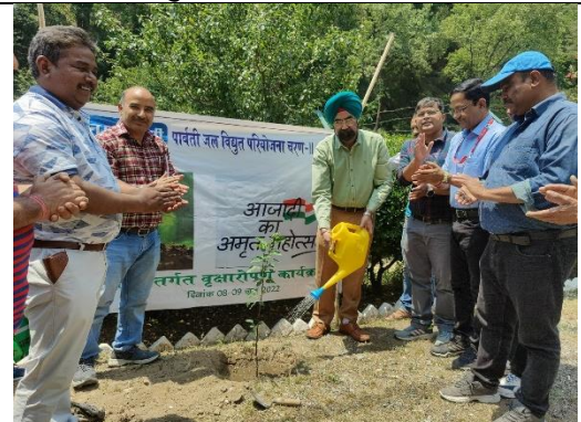
पार्वती - II परियोजना