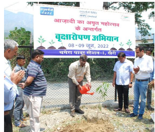
चमेरा- I पावर स्टेशन