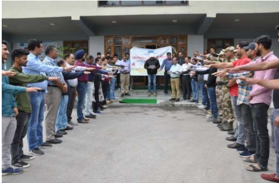
दुलहस्ती पावर स्टेशन