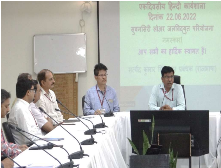
हिन्दी कार्यशाला को संबोधित करते हुए कार्यपालक निदेशक महोदय