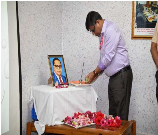
तीस्ता-V पावर स्टेशन