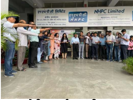
क्षेत्रीय कार्यालय चंडीगढ़