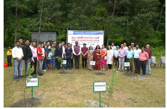
तीस्ता-V पावर स्टेशन