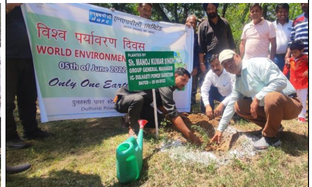
दुलहस्ती पावर स्टेशन