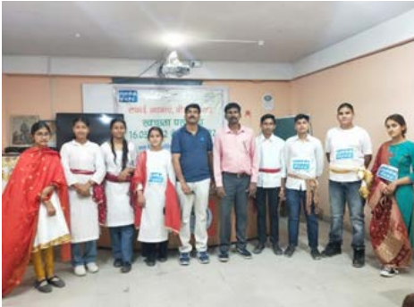
पार्वती - II परियोजना