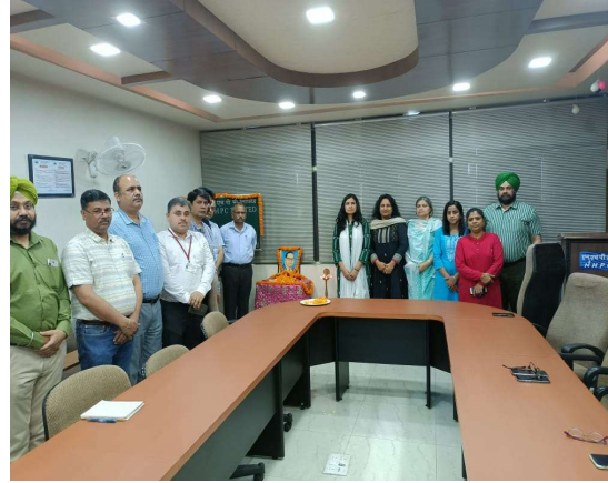
क्षेत्रीय कार्यालय जम्मू